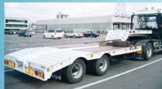
2軸 8輪重機運搬用トレーラー (軽量、シングルトラクター連結可) 2-axle 8-wheel heavy-duty machinery transport trailer (possible to couple light-duty single tractor)