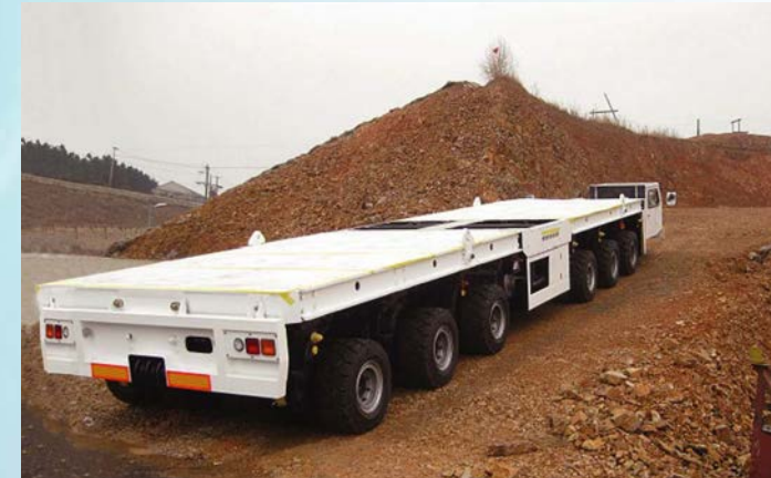
ノンスリップ制御付きキャリヤ(未舗装傾斜試験 80t 19%) Nonslid-controlled carriers (Unpaved slope test, 80 tons: 19%)