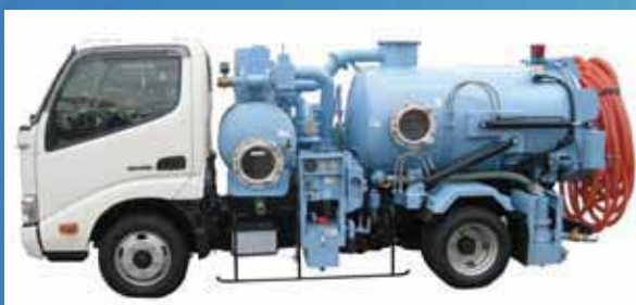
1.4m³ 吸引車 Suction vehicle